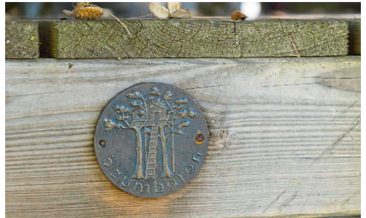
/ Nur wenn sie mit der bronzenen Plakette gekennzeichnet sind, können sich die Baumbarone von ihren Werken verabschieden.