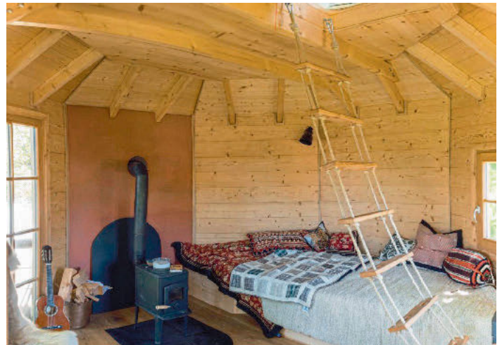
/ Das Innere der Baumhäuser ist besonders kuschelig, weil sie so liebevoll nach den Wünschen der Bewohner und Bewohnerinnen gestaltet sind.