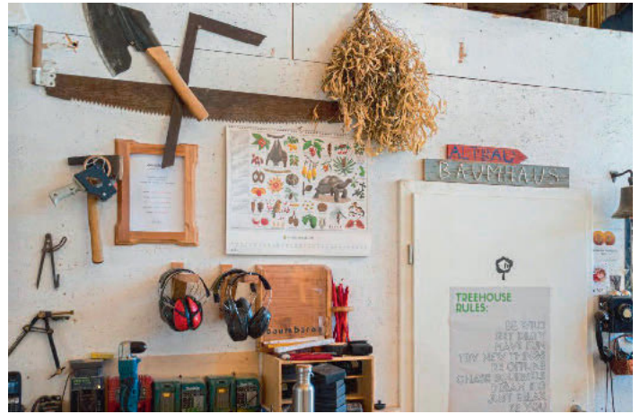
/ Die Baumhausregeln lauten: Sei wild! Werde schmutzig! Hab Spaß! Probiere neue Dinge aus! Träume groß! Entspanne dich! Sei du selbst! ....