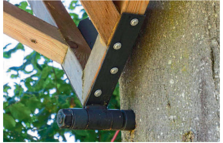
/ Möglichst wenige, gezielt gebohrte Baumschrauben tragen eine immense Last. Der Baum verschließt die Wunden wie nach einem Astbruch.